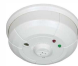
Détecteur de monoxyde de carbone DXS-80