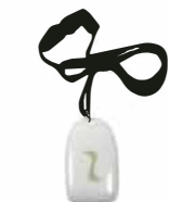
Détecteur pendentif DXS-LRP