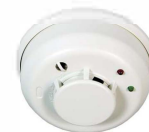
Détecteur de fumée DXS-73