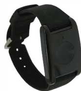
Détecteur bracelet DXS-LRC